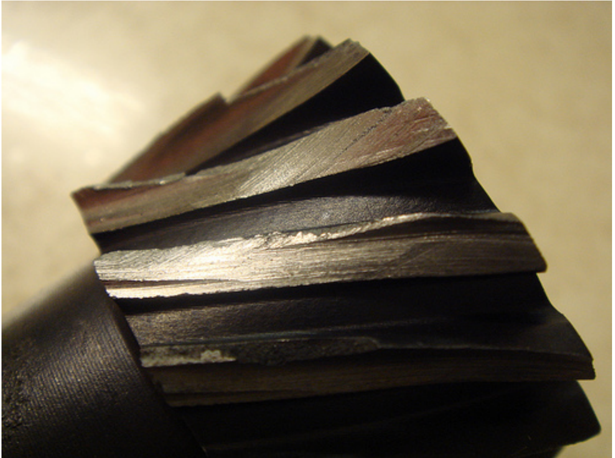
The Rotors cracks and fouling